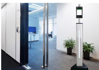
スタンド設置ケース